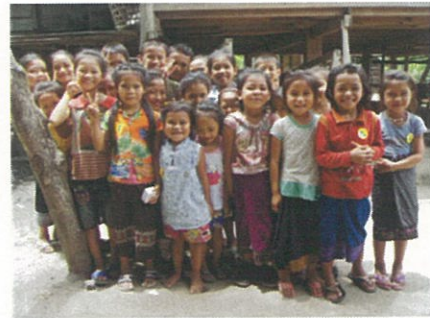
たくさんの笑顔を守るワクチン

最貧地域の一つキューケア村のチューポー村長から皆さまへ、嬉しい報告と感謝の言葉です。