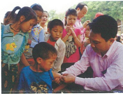
ラオス キューケア村でのワクチン接種

「ワクチンを打つようになってから、病気で亡くなる子どもが減った。ワクチンを支援してくれるJCVと日本の皆さんに感謝を伝えたい。」