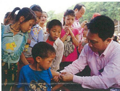
ラオス キューカレア村でのワクチン接種

「ワクチンを打つようになってから、病気で亡くなる子どもが減った。ワクチンを支援してくれるJCVと日本の皆さんに感謝を伝えたい。」