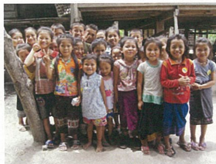
たくさんの笑顔を守るワクチン

最貧地域の一つキューカレア村のチューポー村長から皆さまへ、嬉しい報告と感謝の言葉です。